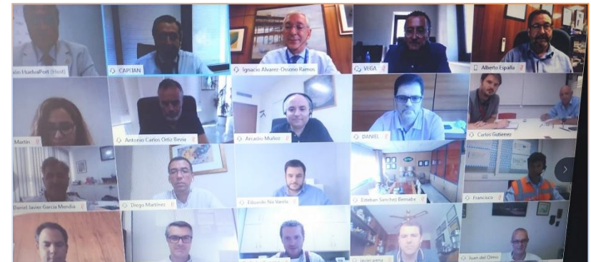
HuelvaPort ha celebrado el día 30 de junio su asamblea general.

empresarial con actividades relacionadas con el Puerto de Huelva a sumarse a HuelvaPort para continuar creciendo y aumentando la oferta de servicios del propio Puerto. Ponce ha valorado positivamente la explotación de Astilleros de Huelva por parte de Nuevo Astillero de Huelva S.A.