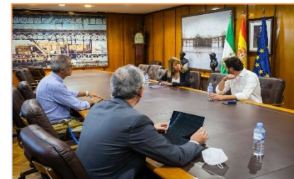
Acuerdo de APH y la Cámara de Comercio.

y servicios a la Comunidad Portuaria, además de un centro de formación y formación dual y un centro de fabricación de turbinas marinas, con una previsión de creación de 200 puestos de trabajo fijos, que podrían llegar a los 1.500 sumando los indirectos e inducidos. Asimismo, Nuevo Astillero de Huelva se ha incorporado como nuevo socio a HuelvaPort.